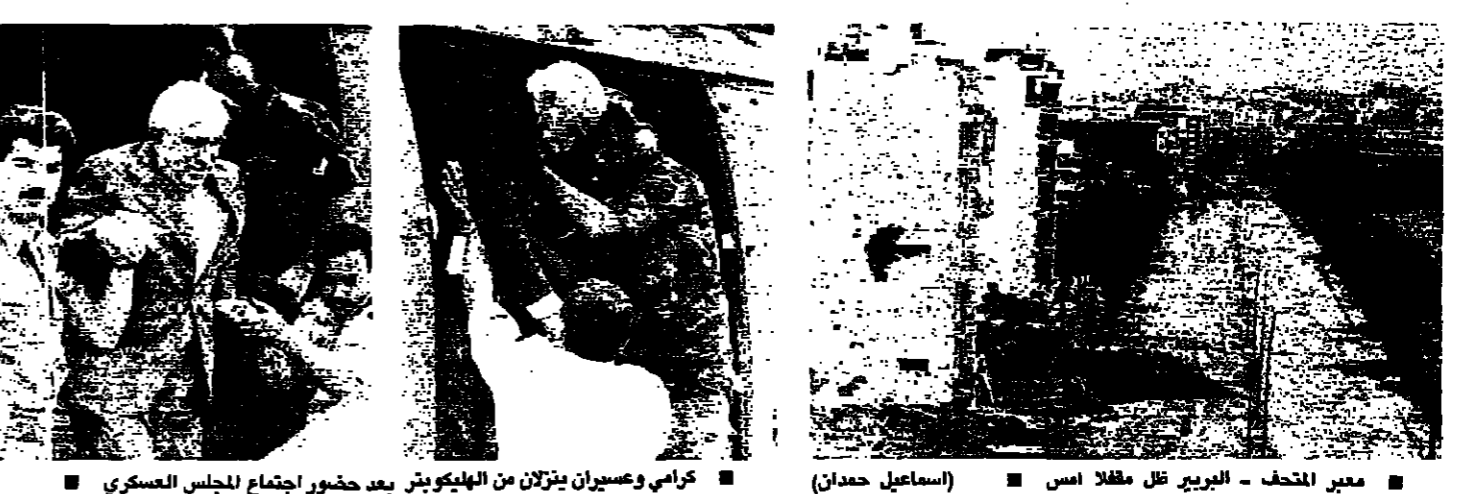
معبر المتحف - البربري ظل مقلدا امس (اسماعيل حداد)